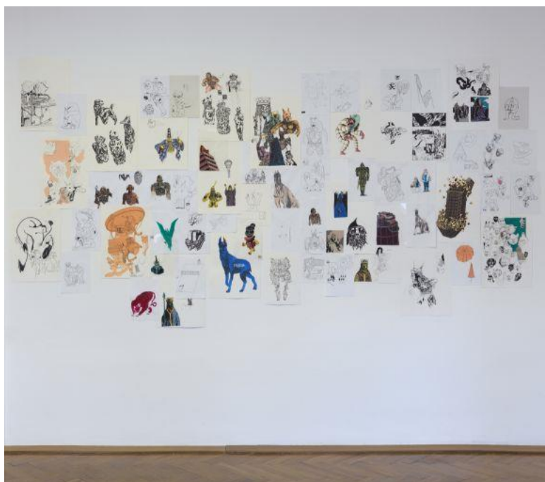
Utrinek z razstave.