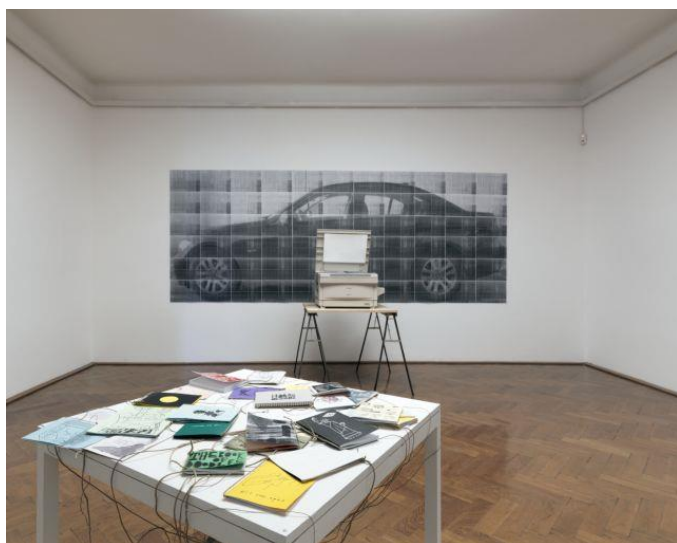
Utrinek z razstave.

Ob nastopu sodobnih informacijskih tehnologij so fanzini doživeli temeljito preobrazbo in so danes predvsem medij večinoma mlajših ustvarjalcev. Od politično angažiranega fanzina so prešli k veliko bolj individualiziranemu umetniškemu zinu (artzinu).