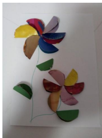
Papir iz reklam